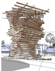
Uitzicht en Beleving

Er moet dus nog ca. €500.000 aan extra kapitaal gevonden worden om tot 50% van het eigendom in het Project te komen. Dat bedrag wordt gezocht onder inwoners en bedrijven in Zeewolde. Daarvoor bewandelen we twee paden. We bieden aan om een obligatielening aan ZZB te geven. Die obligatielening is met name het onderwerp van dit Informatie Memorandum.